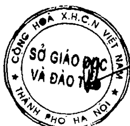
Chử Xuân Dũng